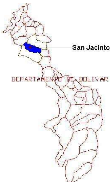
San Jacinto en el Departamento. 1